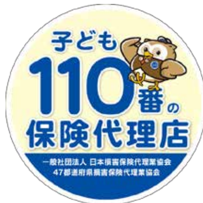
丸型ステッカー 直径246mm