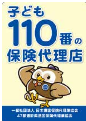
縦長ステッカー 横170mm 高さ240mm